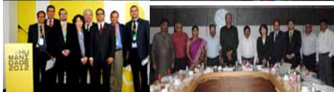
上: IPLA 国際フォーラム「グリーン経済に向けたゼロ・ウェイストの取組み - 地方自治体の役割」(2011 年 10 月 17-18 日、韓国・大邱市、韓国環境省および UNCRD 共催) 左下: リオ+20 における IPLA サイドイベント「持続可能な都市へ向けたゼロ・ウェイスト政策と行動」(2012 年 6 月 19 日、ブラジル・リオデジャネイロ市) 右下: 「アーメダバード市のゼロ・ウェイストに向けたロードマップ」の策定に関する関係者協議会 (2012 年 9 月 11-12 日、インド・アーメダバード市)