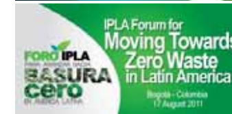
左: 2013 年 1 月に UNCRD およびゼロウェイスト・サウスオーストラリアの支援の下でインド・アーメダバード地方自治体が策定した「アーメダバード市のゼロ・ウェイストに向けたロードマップ」 右上: IPLA の初開催の国際フォーラム(2011 年 10 月 17-18 日、韓国・大邱市) 右下: ゼロ・ウェイストに関する IPLA ラテンアメリカ・フォーラム(2011 年 8 月 17 日、コロンビア・ボゴタ市)